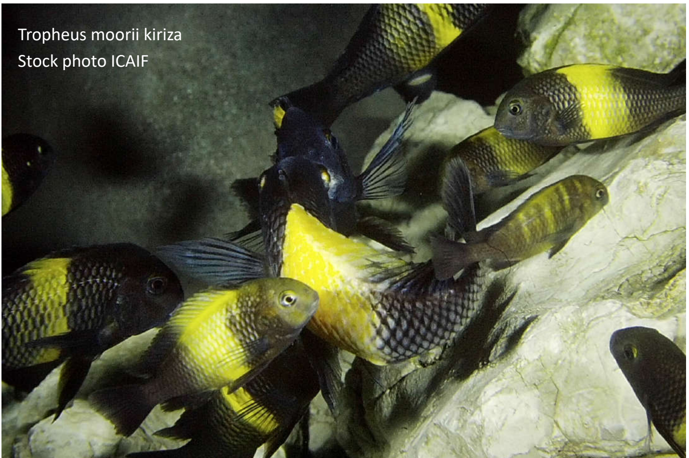
Tropheus moorii kiriza

Le taux de protéines est extrêmement bas (15 à 20%) et pourtant les poissons sauvages sont souvent assez gros et gras. Leur tractus intestinal a besoin d'être alimenté en permanence, c'est pourquoi il faut nourrir souvent mais en petite quantité parce qu'ils passent 80% de leur temps à brouter.