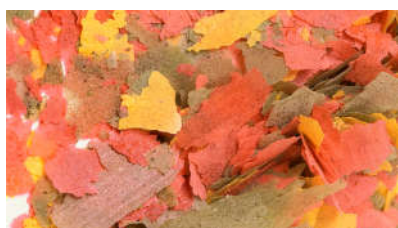
Paillettes > 27/6 > Oui

En attendant dans le cadre de l'économat et des achats groupés, le club vous propose une offre de matériels, plantes, nourritures vivantes ainsi que le traditionnel achat groupé de nourriture congelée. L'ensemble de cette offre est rassemblée dans un feuillet qui accompagne cette revue.