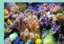
Eau de mer