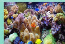
Eau de mer