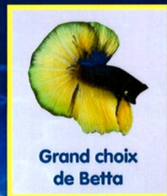
Grand choix de Betta