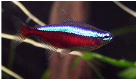
Paracheirodon cardinalis (Cardinalis)

Il s'agit bien sûr du poisson ! C'est d'ailleurs assez grave qu'on le « dégrade » souvent en l'appelant « néon ». Pourtant, la différence est assez visible : il suffit de regarder la bande rouge qui se limite à la moitié du ventre chez le néon mais qui se prolonge sur toute