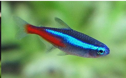
Paracheirodon innesi (Néon)

la longueur chez le cardinal. Ce dernier devient un peu plus grand que son cousin néon.