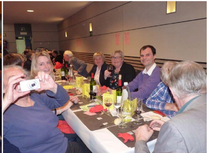
Notre congrès est toujours une excellente occasion de rencontre.